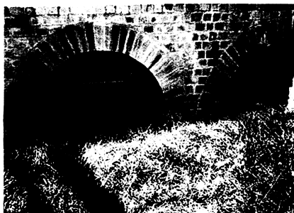
... zeugen von der Präsenz der Römer in Dalheim